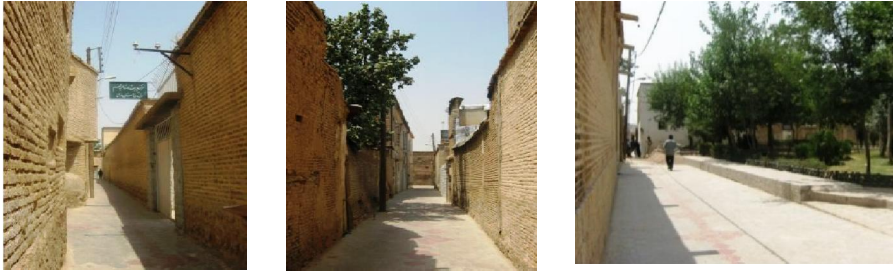
تصویر ۱: کیفیت‌های فضایی گذر اکباتان