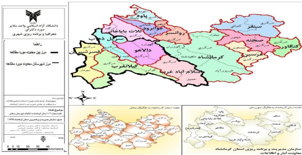
شکل شماره ۳. نقشه محدوده مورد مطالعه

برای محاسبه نمونه از فرمول کوکران با خطای استاندارد ۵ درصد و سطح اطمینان ۹۵ درصد استفاده شده است. حجم نمونه ۳۲۳ نفر برآورد گردید که برای روایی بیشتر به ۳۸۶ پرسشنامه افزایش یافت.