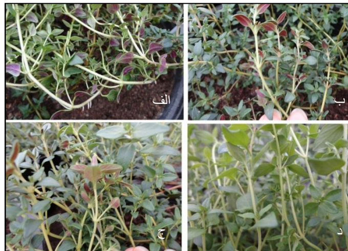
شکل ۳: تفاوت ظاهری میزان آنتوسیانین موجود در پشت برگ‌های آویشن باغی در دزهای مختلف

ب) تأثیر شدت‌های مختلف اشعه گاما روی درصد اسانس آویشن باغی