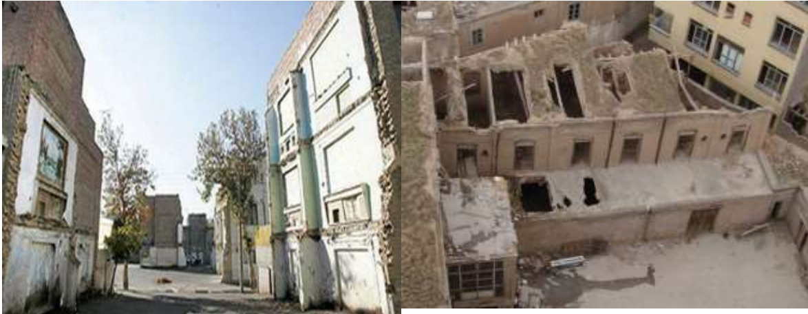
شکل ۲. تصاویری از بافت فرسوده منطقه ده تهران (شهرداری منطقه ده، ۱۴۰۰)

منطقه محسوب می‌گردد. شاخص‌های فرهنگی منطقه، نظیر میزان باسواد و جمعیت دارای تحصیلات عالی، پایین‌تر از حد متوسط کلان‌شهر تهران است. کلیه شاخص‌های مسکن در سطح منطقه ده حاکی از فرسودگی