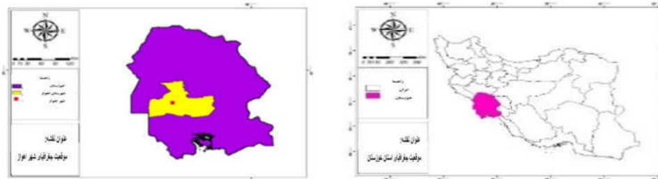
نقشه (۱): موقعیت استان خوزستان، شهرستان و شهر اهواز

خیابان ایت الله طالقانی در مرکز شهر اهواز و در منطقه‌ی یک شهرداری واقع شده است (نقشه ۲) این منطقه ۱۲۵۰۲۵ نفر جمعیت داشته است (نفوس و مسکن سال ۹۰) و بر اساس آمار شهرداری مرکزی، منطقه یک شهرداری به ۵ ناحیه خدمات شهری تقسیم شده است. (ناحیه ۱،۲،۳،۴ و ناحیه