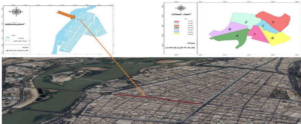
نقشه (۲): محدوده مناطق هفت گانه شهر اهواز، محدوده منطقه یک و محدوده خیابان طالقانی در منطقه یک