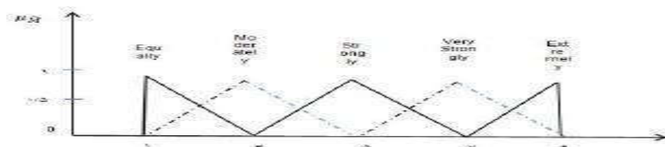
شکل (۱): تابع عضویت فازی برای متغیرهای زبانی

روش FAHP ارایه شده، شکل تعمیم‌یافته‌ای از روش AHP کلاسیک می‌باشد. در این روش برای مقایسه زوجی گزینه‌ها از اعداد فازی و برای به دست آوردن وزن‌ها و ارجحیت‌ها از روش میانگین‌گیری هندسی استفاده می‌گردد. چراکه این روش به سادگی به حالت فازی قابل تعمیم می‌باشد و همچنین جواب یگانه‌ای برای ماتریس مقایسات زوجی تعیین می‌نماید (هانگ،