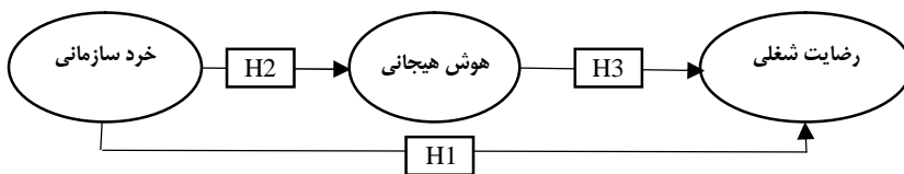
شکل شماره 1: مدل مفهومی پژوهش (محقق ساخته)

با توجه به مطالب فوق که برگرفته از تئوری‌ها و پیشینه در این حوزه است و اینکه متغیر مستقل خرد سازمانی بر متغیر وابسته رضایت شغلی؛ متغیر مستقل خرد سازمانی بر متغیر وابسته هوش هیجانی و متغیر مستقل هوش هیجانی بر متغیر وابسته رضایت شغلی تأثیر دارد، می‌توان فرضیه زیر را تدوین کرد: فرضیه 4: خردسازمانی بر رضایت شغلی با توجه به نقش میانجی هوش هیجانی تأثیر دارد. در نهایت مدل مفهومی پژوهش در شکل 1 آورده شده است: