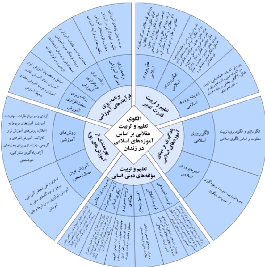
شکل شماره ۳: مدل مفهومی استخراجی از روش فراترکیب

مدل مفهومی اولیه پژوهش: مدل مفهومی اولیه تحقیق متشکل از: ۵ مقوله (ابعاد): «تعلیم و تربیت قدرت تدبیر»، «یادگیری بر مبنای آموزه‌های اسلامی»، «بهره‌مندی از آموزش‌های پویا»، «برنامه‌ریزی فرآیندهای آموزشی»، «تعلیم و تربیت مؤلفه‌های دینی انسانی» و ۱۶ مفهوم و ۹۸ کد (شاخص) است. با توجه به اینکه در پژوهش حاضر برای مدل‌سازی از روش اکتشافی استفاده شده است. حال از ترکیب چارچوب‌ها و نظریه‌های اشاره شده، مدل مفهومی پیشنهادی پژوهش به صورت شماتیک در شکل (۳) ارائه می‌شود.