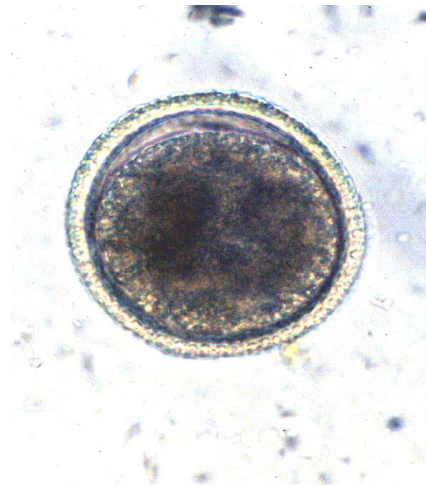
نگاره ۱- تخم توکسوکارا کنیس داخل نمونه خاک (X۴۰۰).