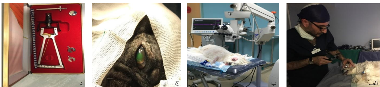
شکل ۱- الف: معاینه چشم با افتالموسکوپ مستقیم، ب: معاینه چشم با میکروسکوپ جراحی، ج: رنگ آمیزی چشم با فلورسئین، د: تونومتر شیوتز

عمومی پنی سیلین ۶,۳,۳ (داروسازی دانا، تبریز، ایران) با دوز ۳۰۰۰۰ واحد به ازای هر کیلوگرم و ضد التهاب غیراستروئیدی ملوکسیکام ۲ درصد (لابراتور رازک، تهران، ایران) با دوز ۰/۲ میلی‌گرم به ازای هر کیلوگرم وزن بدن جهت کاهش درد و التهاب به بیمارستان مراجعه کردند. التهاب لایه عروقی چشم ناشی از عدسی مبتلا به کاتاراکت با قطره‌های چشمی سیپروفلوکساسین ۰/۳ درصد (سینادارو، تهران، ایران) و بتامتازون ۰/۱ درصد (سینادارو، تهران، ایران) و در صورت لزوم پردنیزولون خوراکی مهار گردید. همچنین قطره چشمی آتروپین ۰/۵ درصد (سینادارو، تهران، ایران) جهت کاهش درد و حفظ حرکت مردمک و جلوگیری از چسبندگی (synechiae) تجویز گردید. بخیه قرنیه دو