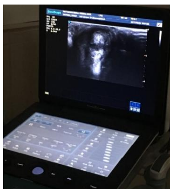
شکل ۲- سونوگرافی چشم برای تشخیص جدا شدن احتمالی شبکیه پیش از جراحی کاتاراکت