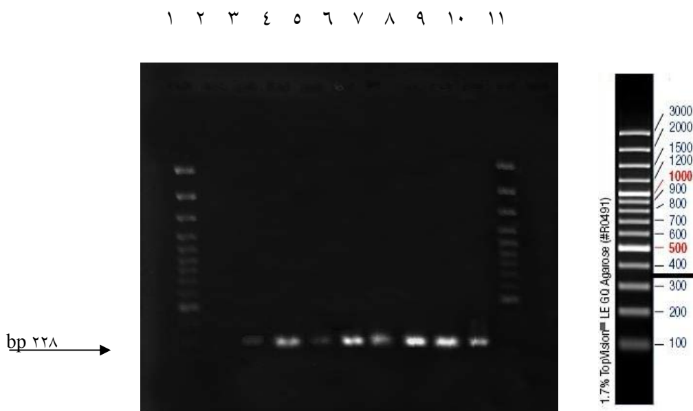
شکل ۱: ردیف ۲ کنترل منفی و ردیف ۱۰ کنترل مثبت و درخانه‌های شماره ۳، ۴، ۵، ۶، ۷، ۸، ۹، نمونه مثبت که قطعه‌ای به اندازه ۲۲۸ bp ایجاد کرده است ردیف ۱ و ردیف ۱۱ نیز حاوی سایز مارکر ۱۰۰ bp DNA ladder plus شرکت Fermentas