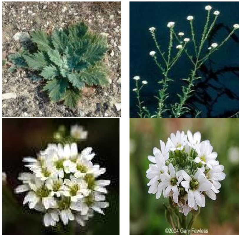
شکل ۱- برگ‌های روزت، ساقه‌های بالغ و گل‌های مجتمع هوری الیسوم

شد تا در طول مدت آزمایش رطوبت بذرها ثابت باقی بماند. سپس محفظه‌های حاوی پتری‌دیش‌ها در انکوباتور با دمای 25 \pm 1 درجه سلسیوس قرار داده شدند و تعداد بذرهایی جوانه‌زده پس از چهارده روز از