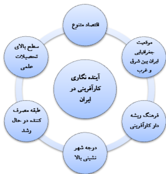
شکل (۱): مدل مفهومی تحقیق. اقتباس از گزارش مکنزی (۲۰۱۶)

براین اساس فرضیه‌های زیر برای پژوهش حاضر در نظر گرفته شده است: