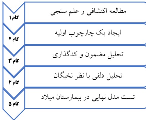
شکل (۱) مراحل کلی انجام پژوهش