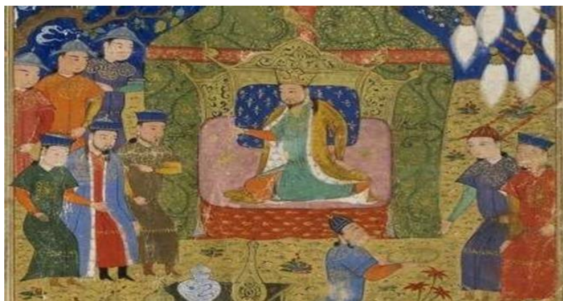
*انواع پوشش سر و تن پوش مغولی، جامع التواریخ، سده هشتم (همدانی: ۱۳۷۳)