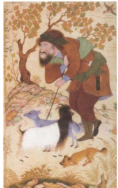
* شبان پیر، رضا عباسی، ۱۰۴۲ ق. (کن بای، ۱۳۸۴: ۱۳۹) {شال، دستار و پای پوش }