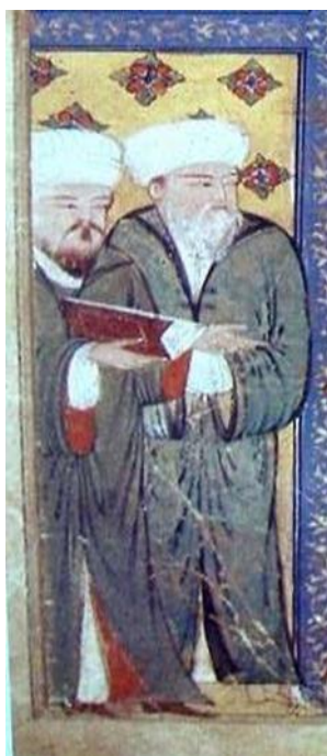
*جامع التواریخ، لباس با استین بلند، سده هشتم (همدانی: ۱۳۷۳)