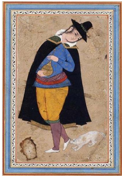
* جوان با لباس فرنگی و شلوارک با سگ، رضا عباسی، ۱۰۳۷ ق. (کن بای، ۱۳۸۹: ۱۵۵)