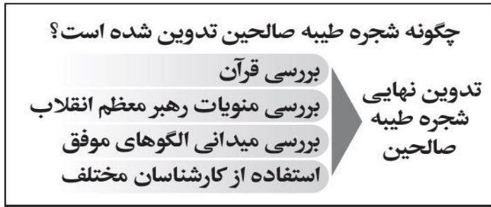
شکل ۱- فرآیند شکل‌گیری شجره طیبه صالحین (فرخی، ۱۳۹۴: ۱۰)

بیان تمام و کمال اعتقادات و باورهای مبنایی در تشکیلات صالحین، کلام را به درازا کشانده و ارائه تصویر از تشکیلات صالحین را مشکل می‌سازد، بلکه شیوه بهتر برای پی بردن به نظام فکری پشتوانه این تشکیلات، بیان و معرفی افراد شاخص و اندیشمندان پیشگام آن نظام فکری است. همان‌طور که در توصیف یک فرد او را به "فرد آعرف" تشبیه می‌کنند.