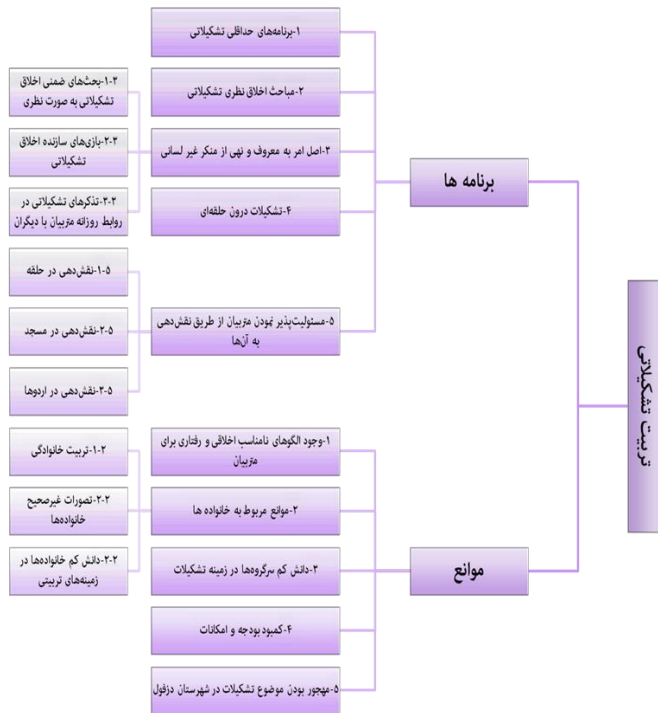
شکل ۳- تحلیل مضمون نهایی مصاحبه‌های عمیق