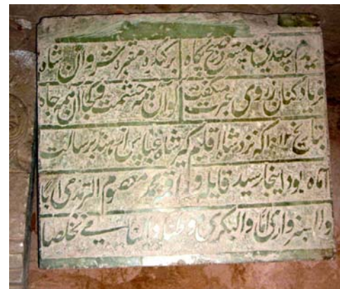
تصویر شماره ۱: کتیبه سنگی میر معصوم بکری.