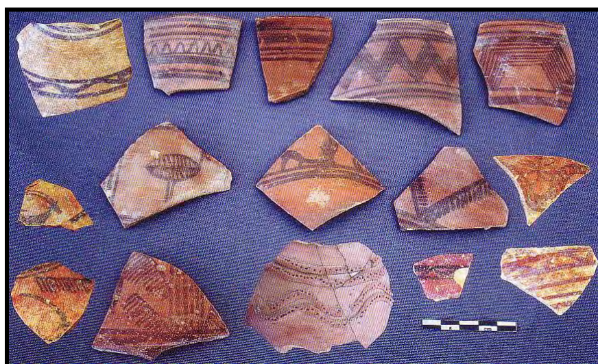
تصویر ۵: سفال‌های شاخص تپه کنارصندل جنوبی (برگرفته از Madjidzade, 2008).