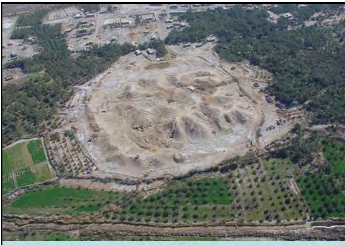
تصویر ۳: عکس هوایی تپه کنار صندل شمالی.