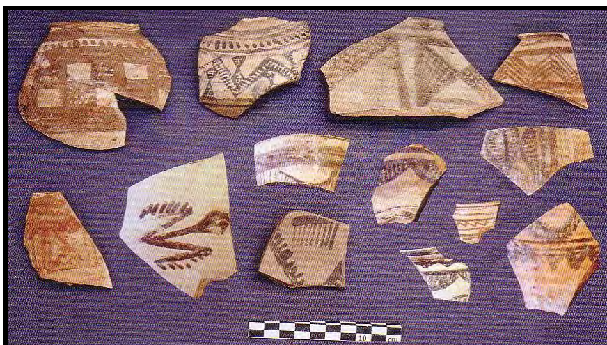
تصویر ۴: سفال‌های شاخص تپه کنارصندل جنوبی (برگرفته از Madjidzade, 2008).