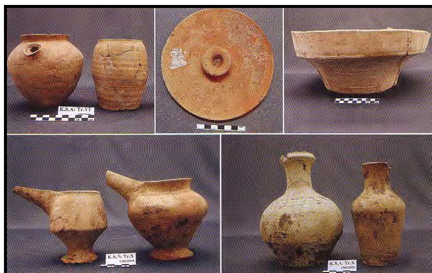
تصویر ۶: سفال‌های شاخص تپه کنارصندل شمالی (برگرفته از Madjidzade, 2008).