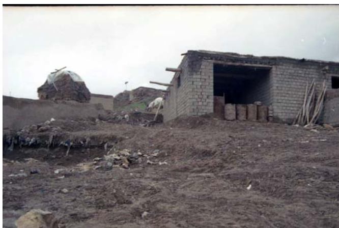
تصویر ۲- خانه‌های روستایی بر روی محوطه قره‌گویز مرکزی