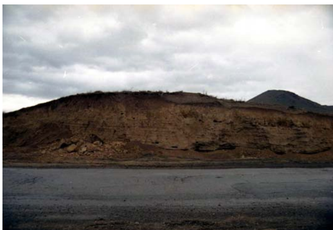
تصویر ۴- قره‌گویز ۲ و سرنوشتی شبیه به قره‌گویز ۱