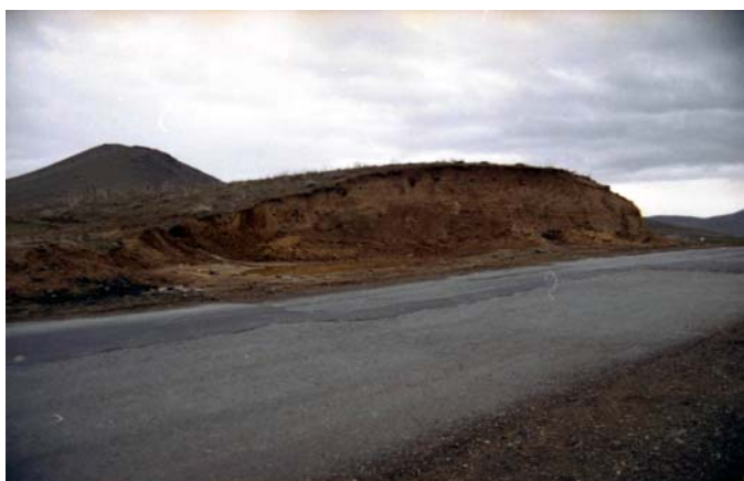
تصویر ۳- آسیب شدید جاده سازی و برش تپه قره‌گویز ۱