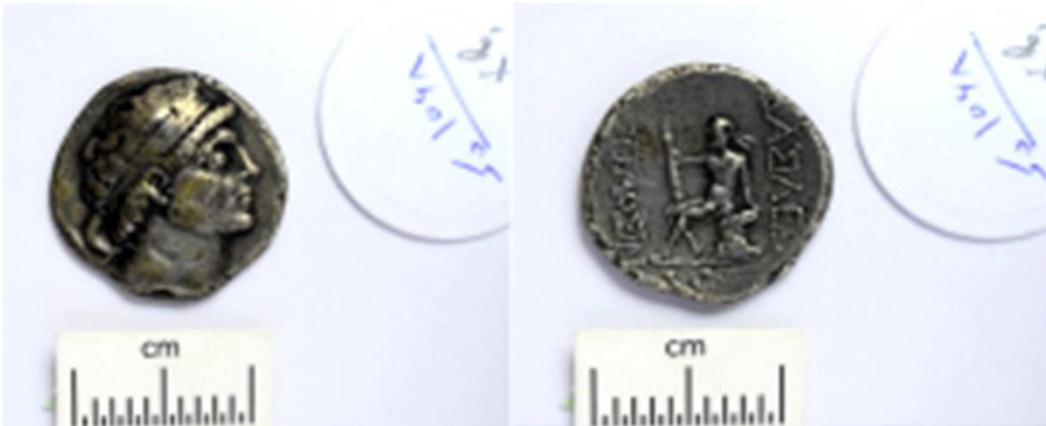
Figure 1: Tetradrachm of Hyspaosines; the National Museum of Iran, No. 1068.