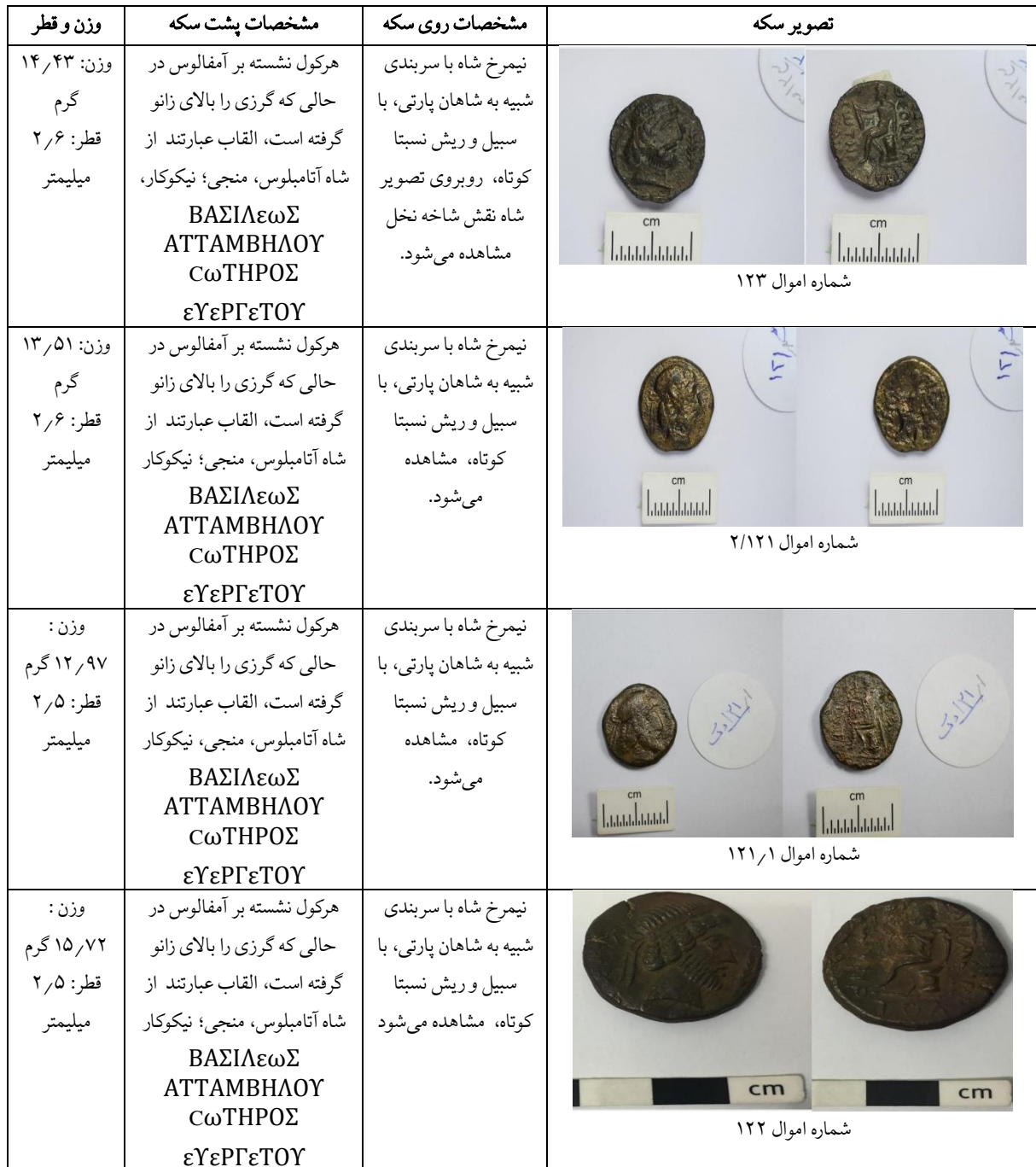
جدول ۷: سکه‌های چهاردرهمی آتامبلوس چهارم، موزه ملی ایران.

سکه‌های خاراسن مشاهده می‌شود. در این دوره، به تدریج خط آرامی در پشت سکه‌ها جایگزین خط یونانی می‌شود (سلوود، ۱۳۹۰: ۴۱۶). از زمان بلاش سوم برای تحکیم دولت پارتی تصمیم گرفته می‌شود که اداره حکومت‌های محلی را به اشراف‌زادگان پارتی بسپارند و بدین‌گونه دودمان‌های محلی از میان برداشته می‌شوند و افرادی از شاخه فرعی خاندان پارتی در خاراسن به حکومت می‌رسند. بدین ترتیب، در خاراسن حکومت از