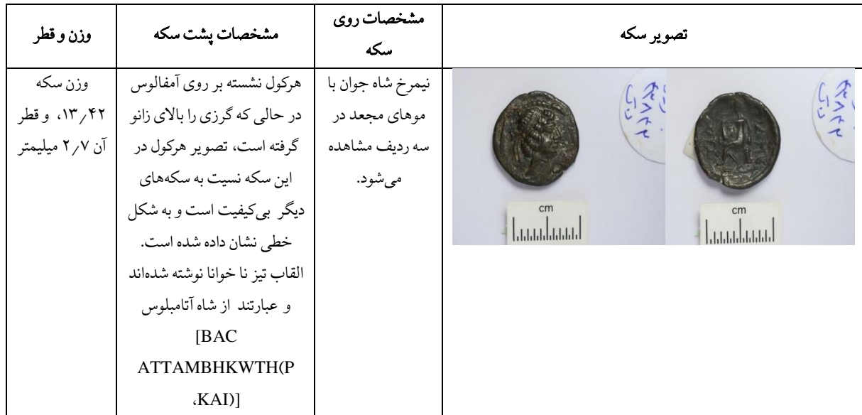
جدول ۶: سکه چهاردرهمی آتامبلوس سوم، موزه ملی ایران، شماره اموال ۴۳۸۴۲

سمت رومی‌ها تمایل نشان داده است. آن‌ها احتمالاً پارتی‌ها را تهدیدی برای سرزمین و تجارتشان می‌دانستند و به همین دلیل، برای مقابله با آن‌ها با روم هم پیمان شدند. آتامبلوس در طی دوران حکومتش سکه‌های متنوعی را ضرب کرده و چهره او از جوانی تا پیری بر روی سکه‌ها به تصویر کشیده شده است (جدول ۷). همچنین، در این دوره با تهاجم ترابانوس به بین‌النهرین مواجه هستیم و پای رومی‌ها به خاراسن کشیده شده و حاکم خاراسن از فرستادگان رومی به گرمی استقبال کرده است (سلوود، ۱۳۹۰: ۴۱۵).