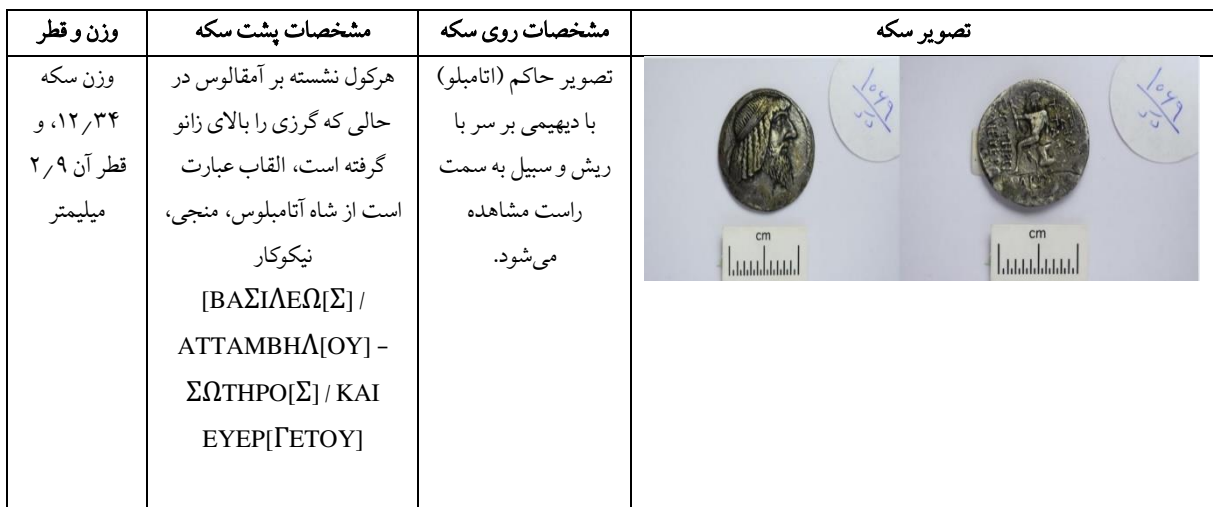
جدول ۴: سکه چهاردرهمی آتامبلوس اول، موزه ملی ایران، شماره اموال ۱۰۶۹

حکومت ارد دوم (۳۸-۵۵ ق.م) هم‌زمان بوده است. ارد دوم هنگامی به حکومت رسید که رومی‌ها، آسیای صغیر و قسمت‌هایی از بین‌النهرین را تصرف کرده بودند. بنابراین، ارد دوم تصمیم گرفته تا با رومی‌ها وارد جنگ شود. مهم‌ترین اتفاق سیاسی زمان ارد دوم، جنگ حران، بین روم و ایران است. این جنگ با کشته شدن کراسوس (سردار رومی) توسط سورنا، به پیروزی پارتی‌ها بر رومی‌ها می‌انجامد. نتایج این پیروزی برای شاه پارتی عبارت بود از بدست آوردن اراضی بین‌النهرین تا حدود فرات و تعیین مرز ثابت بین ایران و روم. همچنین، ارمنستان دست‌نشانده ایران گردید (مشکور، ۱۳۷۴: ۲۳۱-۲۲۵). با بررسی سکه‌های آتامبلوس اول، سرپوش شاه با سرپوش ارد دوم شباهت دارد (جدول ۴).