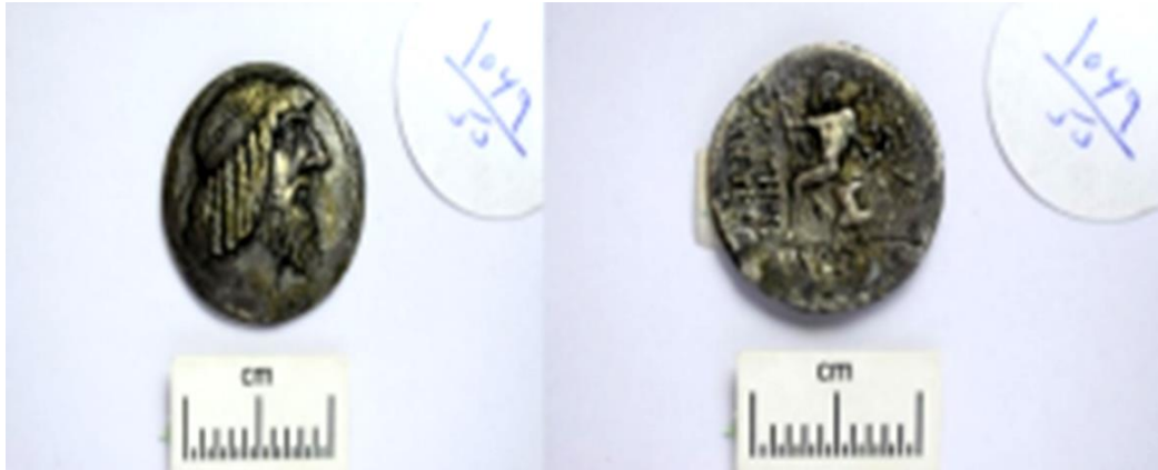
Figure 3: Tetradrachm of Attambelos I, the National Museum of Iran, No. 1069.

are without the king's name. In some instances, the king's name is inscribed in Aramaic script. On the obverse of the coins is the profile of the ruler with the headscarf of the Parthian king, and on the reverse is the image of the crown prince as well as written in Aramaic script: "Mega son of King Attambelos". This indicates that during this period, Parthian kings were able to subjugate Characene.