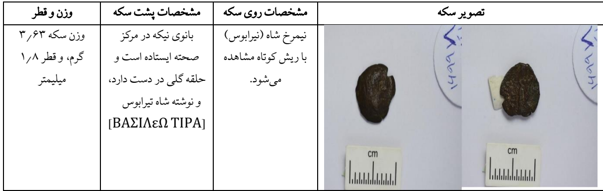
جدول ۳: سکه برنزی تیرابوس، موزه ملی ایران، شماره اموال ۱۶۹۹۱۸

ضرب این سکه نشان می‌دهد که تیرابوس از ضعف پارتی‌ها استفاده کرده و توانسته در یک اقدام نظامی پیروزی بدست بیاورد. از این‌رو، به ضرب سکه‌های متفاوت از سکه‌های رایج خاراسن دست می‌زند (سلوود، ۱۳۹۰: ۴۱۳). این می‌تواند تأیید کند که از سال ۱۰۹ ق.م تا ۹۱ ق.م مهرداد دوم فعالیت حاکمان خاراسن را متوقف کرده و اجازه فعالیت‌های اقتصادی به آنها نداده است. با مرگ مهرداد دوم و نا آرامی‌های بوجود آمده در بین اشراف‌زادگان پارتی، حاکم خاراسن از این فرصت استفاده کرده و سکه‌های جدید ضرب کرده است. بدین ترتیب، نا آرامی‌ها و نزاع‌های داخلی پارتی‌ها به تیرابوس و شاهان بعدی خاراسن اجازه داده تا ارتباطات اقتصادی و تجاری خود را با مناطق عرب نشین خلیج فارس از سر گیرند. شاه بعدی خاراسن، آتامبلوس اول نام دارد که با