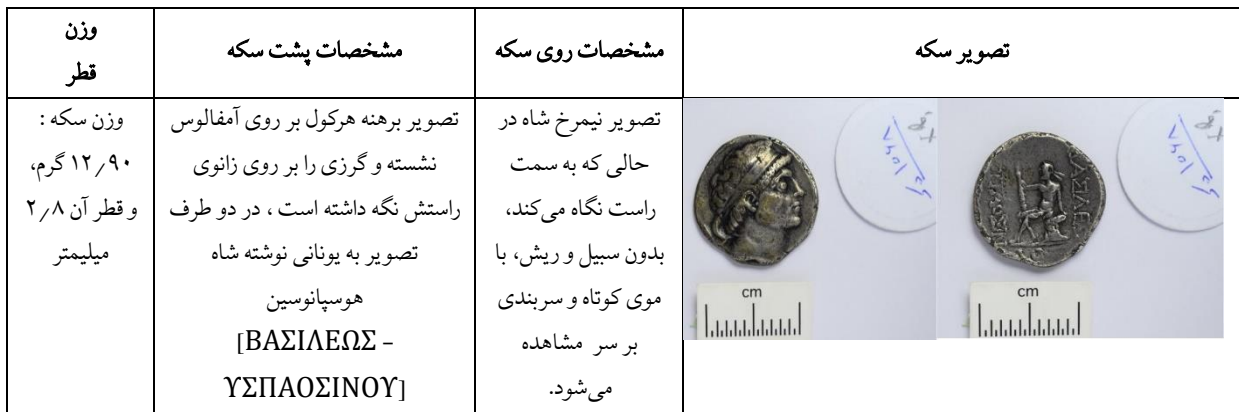
جدول ۱: سکه چهاردرهمی هوسپائوسین؛ موزه ملی ایران، شماره اموال ۱۰۶۸

ق.م ادامه داشته است، تا این که مهرداد دوم در ۱۲۱ ق.م، به حکومت رسید (مشکور، ۱۳۷۴: ۱۶۷-۱۶۸). از وقایع مهم زمان مهرداد دوم بازپس‌گیری بابل در بین‌النهرین است. بنابراین، در ۱۲۱ ق.م با هوسپائوسین وارد جنگ شده، او را شکست داده و برای اولین بار سکه‌های مسی با سبک و سیاق سکه‌های سلوکی در ضرابخانه خاراسن ضرب کرده است (جدول ۲) که نشان از پیروزی مهرداد دوم بر شاه خاراسن دارد (بیوار، ۱۳۸۰: ۱۴۲). با توجه به این که سرپوش شاه در این سکه شبیه به سرپوش مهرداد اول است، بسیاری این سکه را متعلق به مهرداد اول می‌دانند، ولی بنا بر منابع مکتوب، درگیری