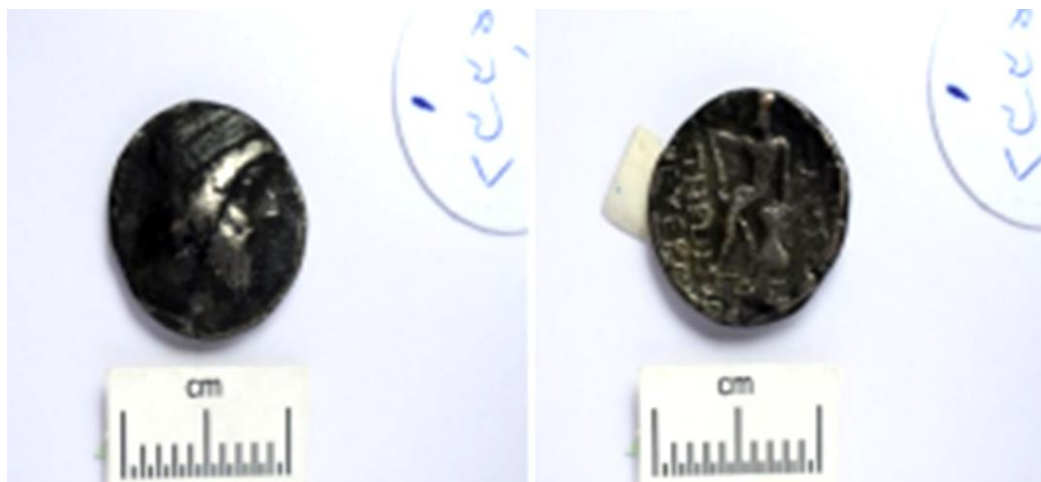
Figure 4: Tetradrachm of Attambelos I, the National Museum of Iran, No. 2335.