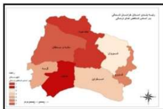
شکل ۴: رتبه بندی و پهنه بندی شهرستان‌های استان خراسان شمالی بر اساس شاخص‌های درمانی

شهرستان بجنورد در بخش شاخص‌های بهداشتی و درمانی در استان رتبه اول را کسب نموده است و این موضوع بیانگر وضعیت مطلوب این شهرستان در این زمینه می‌باشد که از شرایط بحرانی دور هستند. شهرستان مانه و سملقان در جایگاه هفتم قرار دارد که