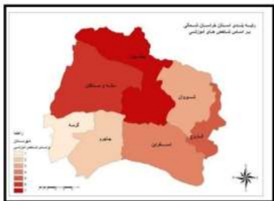
شکل ۲: رتبه بندی و پهنه بندی شهرستان‌های استان خراسان شمالی براساس شاخص‌های آموزشی

شهرستان بجنورد با توجه به این که مرکز استان می‌باشد و با وجود دانشگاه‌های مختلف، متأسفانه با وجود جمعیت نسبتاً زیاد نسبت به سایر شهرستان‌ها در رتبه آخر قرار گرفته است، از سوی دیگر شاید علت آن وجود تعداد کم کتاب و کتابخانه‌های در مرکز این شهرستان (بجنورد) باشد. و بیسوادی و کم سوادی اکثر مهاجرین روستایی به این شهرستان طی دهه