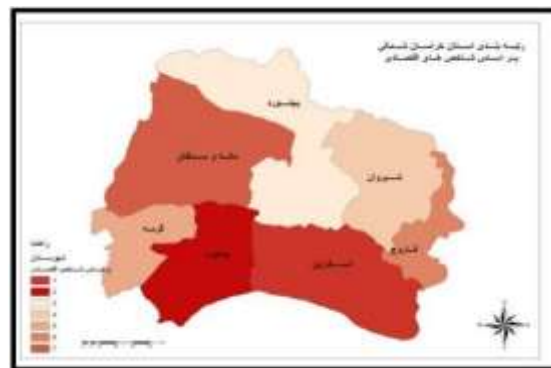
شکل ۳: رتبه بندی و پهنه بندی شهرستان‌های استان خراسان شمالی بر اساس شاخص‌های اقتصادی

شمالی را براساس شاخص‌های اقتصادی و آموزشی را نشان می‌دهد.