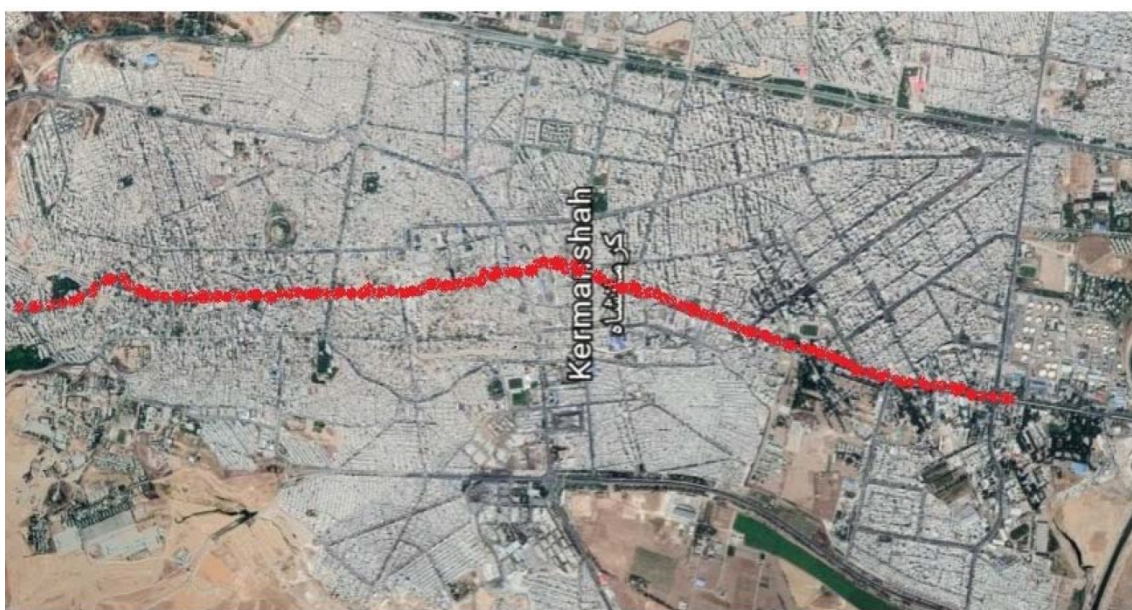
شکل ۱. موقعیت محور قطار شهری کرمانشاه در شهر