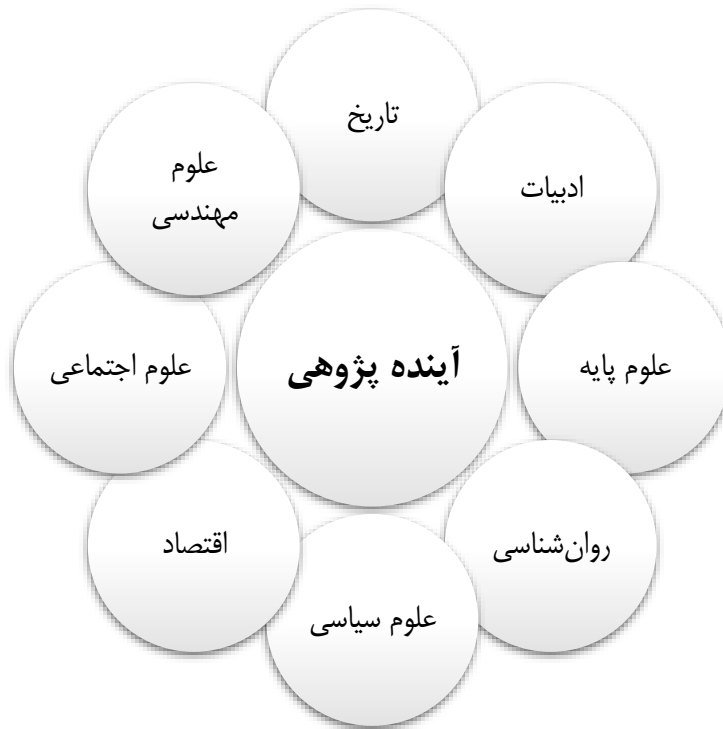
شکل 1- علوم سازنده آینده پژوهی

آن فکر کرد و چگونه می‌توان آن را برای تغییر یا تغییر زمان حال در نظر گرفت. متخصصان آموزش و پرورش این ظرفیت را دارند، زمانی که فرآیندهای آموزشی و روش‌های انجام کارها مختل می‌شود، به آینده خود به صورت علمی و فنی فکر کنند. زمانی که کووید-19 در سال 2020 رخ داد، به نظر می‌رسد که فقط واکنش نشان دادن، به جای اقدام علیه آن به روشی پایدار، یک فرصت ازدست‌رفته است. برای مثال عمل نکردن به آینده بالقوه، می‌تواند عملی غیرمسئولانه باشد و چشم‌پوشی از آن می‌تواند خسارات غیرقابل جبرانی را به همراه داشته باشد. در واقع آینده‌نگری در آموزش این است که سیستم آموزشی قبل از شروع مشکلات، در مورد آینده تفکر نماید و به جای واکنش نشان دادن یا انتظار برای آن، با حرکت به سمت آموزش آنلاین، به صورت فعالانه عمل کند (Tesar, 2020b)؛ بنابراین آموزش و پرورش نهادی است که نیازمند بهره‌گیری از این علم می‌باشد و نمی‌تواند از این موضوع خود را مستثنی کند.