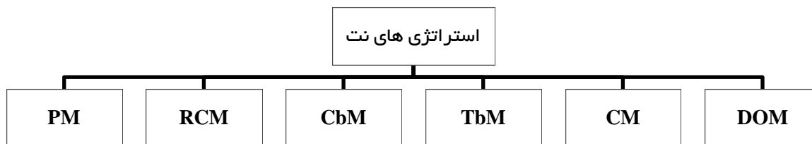
شکل شماره (۲): استراتژی های نت مورد استفاده در پژوهش

در شکل شماره (۲) بطور خلاصه استراتژیهای مورد استفاده در این پژوهش آورده شده است.