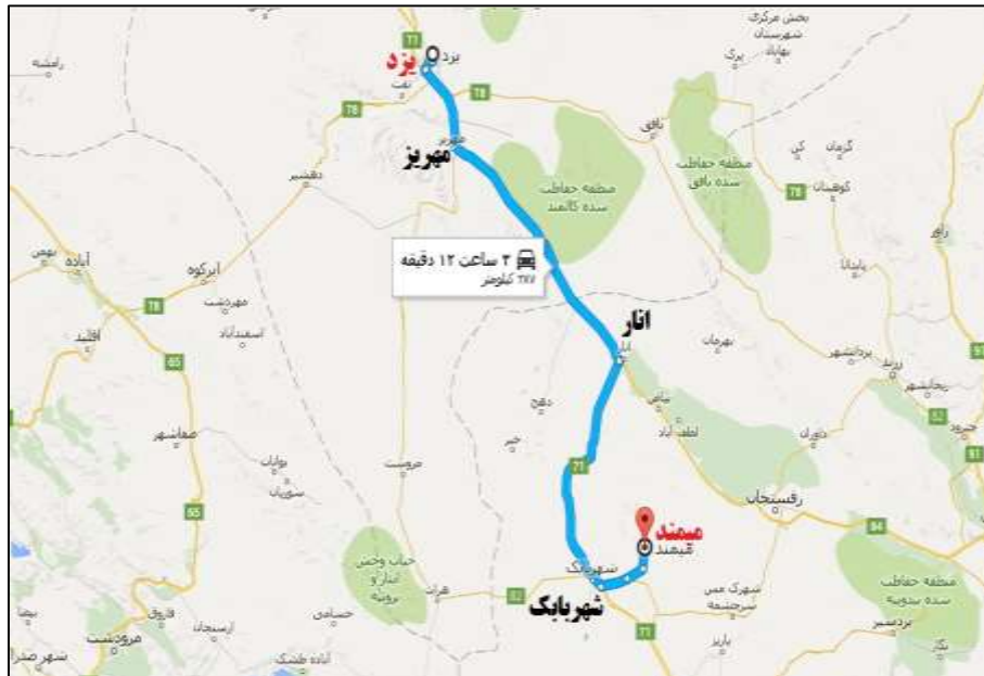
شکل ۲- روستای میمند منبع ( http://visitmeymand.ir )

جدول ۲- ضریب همبستگی پیرسن بین شاخص های اقتصادی کیفیت زندگی با میزان رضایت ساکنان روستای میمند (منبع : محاسبات نگارندگان ، ۱۳۹۶)