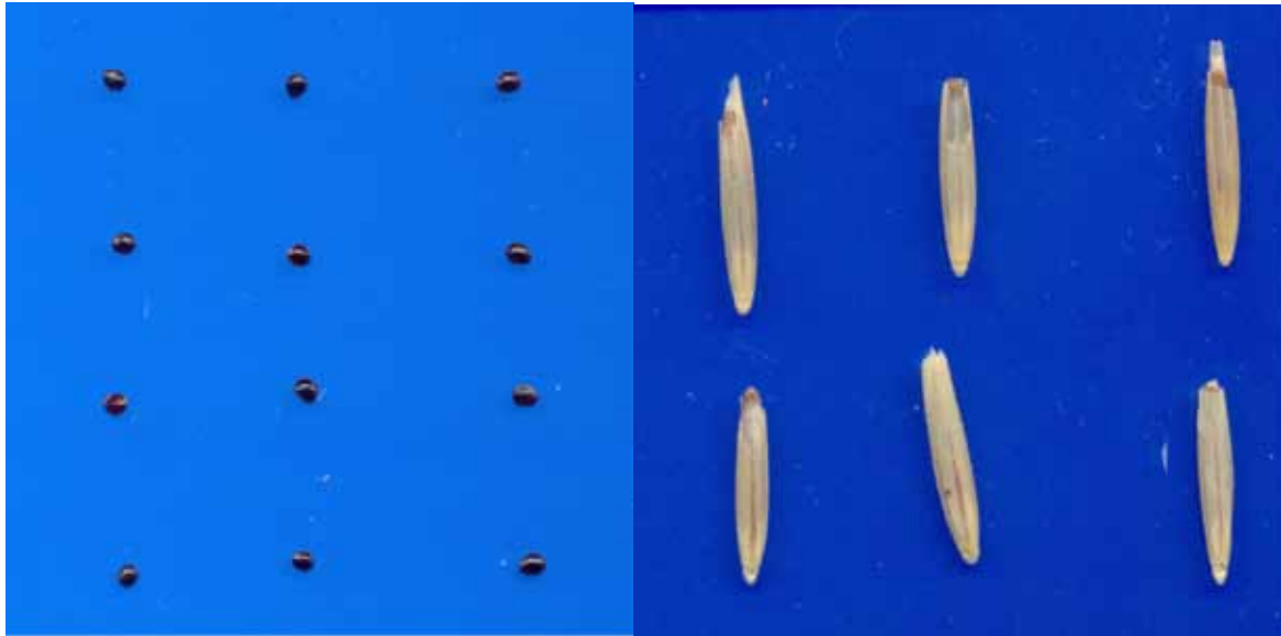
شکل ۳. نمونه تصاویر اسکن شده از بذره‌های A. retroflexus (راست) و T. crinitum (چپ)