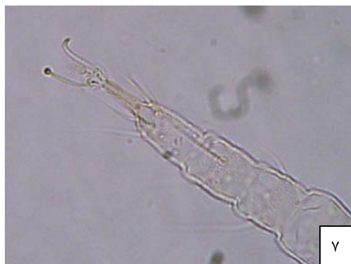
شکل ۵-۷- کنه نر Proctotydaeus schistocerae : ۵- شکل ظاهری