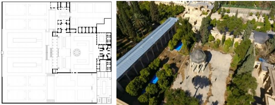
شکل ۱. آرامگاه حافظ (انصاری و نظربلند، ۱۴۰۱)

این آرامگاه در شهر شیراز قرار گرفته است. در ورودی باغ آرامگاه، بعد از حیاط بیرونی، ایوان قرار دارد. ایوان یکی از عناصر معماری ایرانی است و فضای آرامگاه را گویی در قاب عکسی قرار می‌دهد؛ علاوه بر آن، این عنصر امکان دید کامل آرامگاه را می‌گیرد و حالت رمزگونه ایجاد می‌کند. بالای قبر، گنبدی قرار دارد که نماد آسمان است (شکل ۱) (انصاری و نظربلند، ۱۴۰۱).