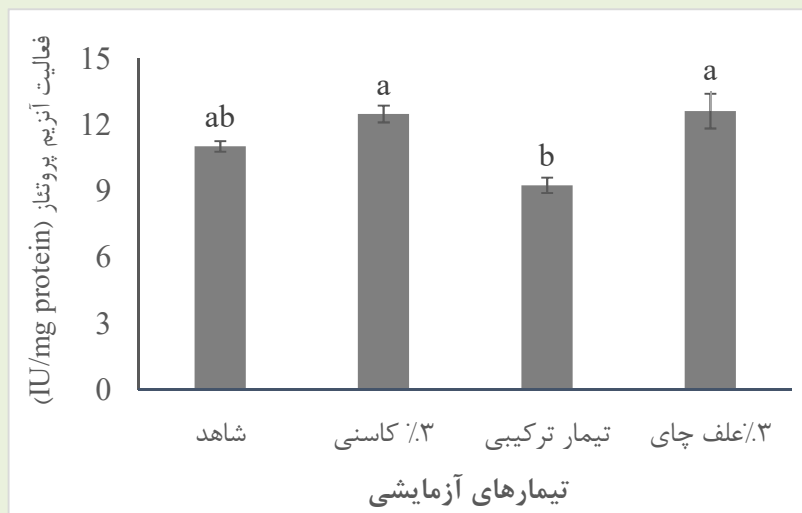
نمودار ۲- فعالیت آنزیم پپتاز در تیمارهای مختلف آزمایشی.

حروف متفاوت نشان دهنده وجود اختلاف معنی‌دار آماری می‌باشد ( P < 0.05 ).