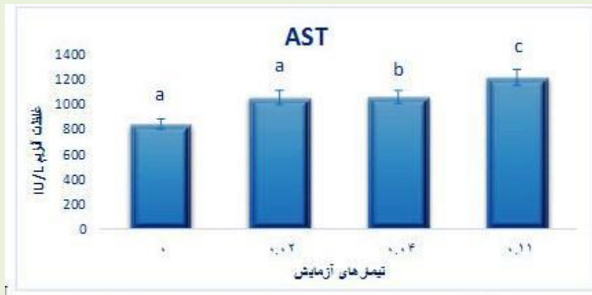
نمودار ۱- تغییرات آنزیم AST کبد بچه ماهی کپور معمولی تحت تاثیر نانوذرات سیلور ( P \leq 0.05 )