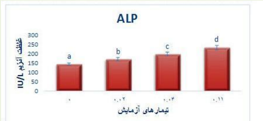
نمودار ۲- تغییرات آنزیم ALP کبد بچه ماهیان کپور معمولی تحت تاثیر نانوذرات سیلور ( P \leq 0.05 )