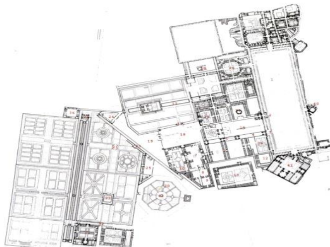
شکل ۳: انسجام و ارتباط باغ ها در خیابان چهارباغ با فضاهای عمومی شهر در باغشهر اصفهان در دوره صفوی (ماخذ: نوروزبرازجانی، ۱۳۸۳: ۶۳)

سبز اروپایی بنا شده اند فاقد چنین ویژگی هایی می باشند. از نمونه های بارز آن می توان به کاشت چمن در پارک ها اشاره نمود که نیازمند آبیاری زیاد بوده و مناسب اقلیم خشک ایران نیست (فدایی تمیجانی، ۱۳۹۰).