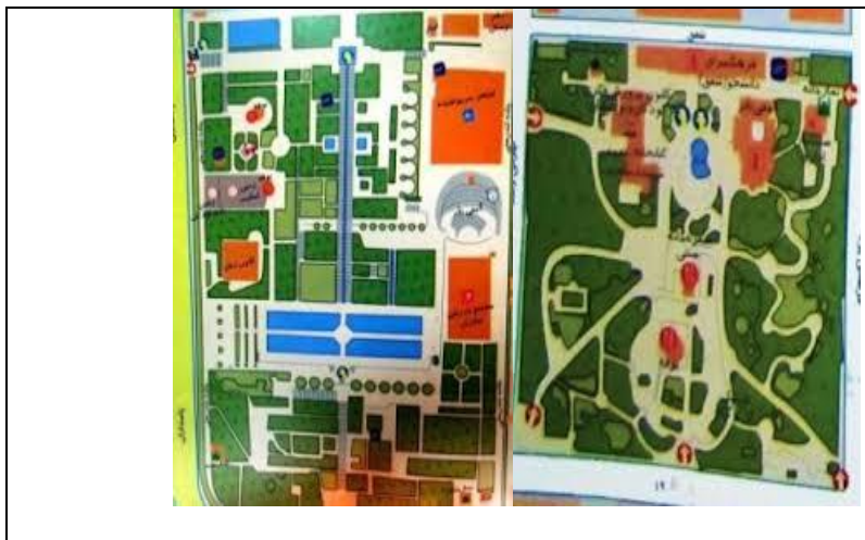
شکل ۲: عدم پیروی از الگوی یکسان در طراحی گونه های مختلف پارک های شهر تهران در دوران قبل و پس از انقلاب. از راست به چپ: پارک شفق و پارک نیاوران (Hamzenejad & Gorji, ۲۰۱۸)

از میان پارک های دوره پهلوی دوم که با رویکردی مدرن و غربی احداث شده بودند، تنها دو پارک شفق و نیاوران با تلفیق از سبک فرانسوی و الگوهای باغ ایرانی ساخته شده بودند (حمزه نژاد و گرجی، ۱۳۹۶: ۳۲). پس از پیروزی انقلاب اسلامی در طی سالهای ۵۷-۸۴، پارک ها با اهداف و مضامین مختلفی همچون کارکردی، جهان شمولی، زیبایی شناسانه و عدالت محوری ایجاد شدن، ولی از لحاظ هندسی اشکال متفاوتی در دوره های مختلف از پارک های ایرانی مشاهده نمی شود. در دوره ای استفاده از خطوط منحنی، در دوره ای دیگر بهره گیری از خطوط منظم و گاه در زمان هایی به منظور ترغیب حرکت و تنوع از خطوط توامان منظم و نامنظم استفاده شده است (همان).