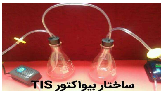
شکل (۱). طراحی و ساخت بیواکتور TIS

قرمز با تناوب نوری ۱۶ ساعت روشنایی و ۸ ساعت تاریکی نگهداری شدند. استفاده از لامپ‌های LED قرمز در اتاقک رشد به علت افزایش ATP مورد نیاز در فرآیند فتوسنتز تاثیر معنی‌داری را افزایش بیوماس و متابولیت‌های ثانویه به ویژه استوبیوزاید نشان داده است (Mujib et al. , 2016). تجزیه آماری داده‌ها پس از بررسی نرمال بودن باقیمانده آنها انجام شد و مقایسه میانگین داده‌ها توسط آزمون دانکن (Duncan, 1955) انجام شد. به منظور تجزیه و تحلیل داده‌ها و رسم نمودارها از نرم افزارهای SAS و Minitab و Excel استفاده گردید.