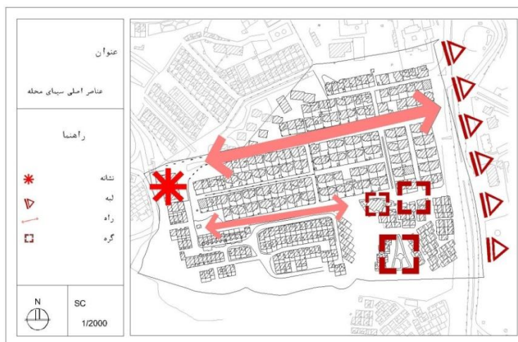
نقشه ۲- عناصر شاخص سیمای محله شالمان منبع: نگارندگان، ۱۳۹۱