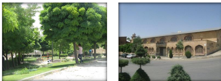
شکل ۱- نشانه در محله، نگارندگان، شکل ۲- گره یا نقاط تجمع