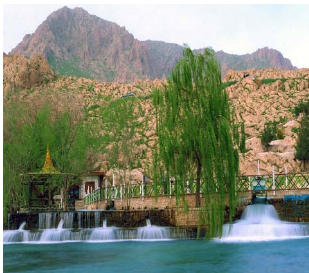
شکل شماره ۲: نمایی از سراب روانسر