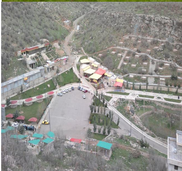
شکل شماره ۱: نماهایی از مجموعه تفریحی- گردشگری غار قوری قلعه در روستای قوری قلعه (شهرستان روانسر)