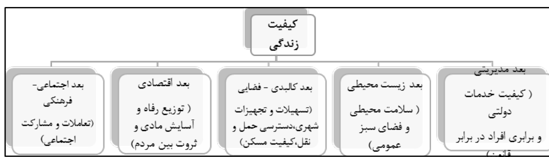
نمودار ۱: ابعاد مختلف کیفیت زندگی

شهری به کارگیری رویکرد بازآفرینی پایدار شهری است (ICOMOS, 2011). بازآفرینی شهری نگرش و اقداماتی جامع و یکپارچه در قالب ارائه چارچوبی استراتژیک، یکپارچه و منعطف برای توسعه و حل مشکلات شهری است به گونه‌ای که در نهایت به یک پیشرفت و بهبود پایدار اقتصادی، کالبدی، اجتماعی و محیطی منجر گردد. یک کنش مشارکت حداکثری تمام ذینفعان به منظور دستیابی همگان به منافع مشروع حاصل از مزایای بازآفرینی در جهت عدالت اجتماعی و رفاه شهری است. در این میان، می‌توان بازآفرینی شهری را به عنوان فرایندی برای توسعه همه جانبه در ابعاد اجتماعی، محیطی و کالبدی تلقی کرد که به دنبال ارتقای کیفیت زندگی و رفاه شهروندان است (Erfanian, 2016).