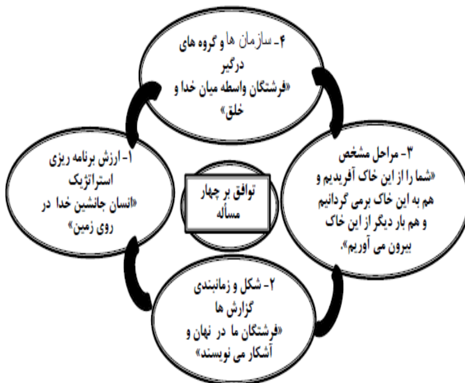
شکل ۲. توافق در برنامه‌ریزی استراتژیک از منظر قرآن (فصلنامه مطالعات قرآنی، شماره ۱۶، ۶۱-۴۷)

طبق این آیه شریفه برای یک تصمیم‌گیری ایده‌آل سه مرحله مهم و اساسی نیاز است که بدون آن‌ها نمی‌توان یک تصمیم درست و منطقی را اتخاذ کرد: (۱) مشورت با افراد شایسته، (۲) بکارگرفتن تصمیم منطقی، (۳) توکل به خداوند متعال. شکل شماره ۲ به طور خلاصه مرحله توافق در برنامه ریزی استراتژیک از منظر قرآن را نشان می‌دهد: