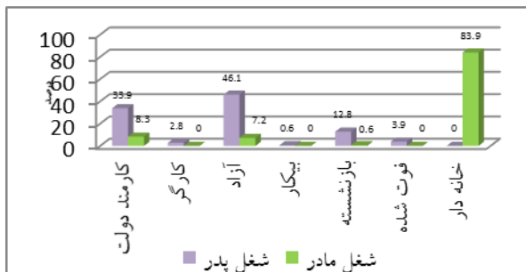
نمودار ۳- توزیع نمونه‌های منتخب با توجه به شغل پدر و مادر