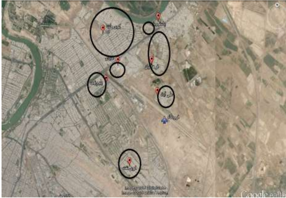
شکل ۱ - تصویر ماهواره ای موقعیت مناطق مورد مطالعه نسبت به فرودگاه