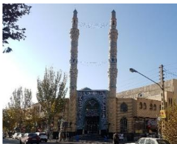
تصویر ۱- مسجد نظیروندی

جامعه نمونه پژوهش حاضر که به کمک نمونه گیری هدف دار انتخاب شده اند، عبارتند از: