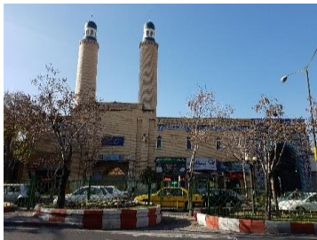
تصویر ۳- مسجد طوبی