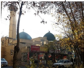
تصویر ۴- مسجد الصادق