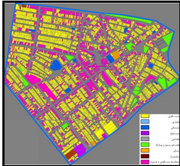
شکل ۳- کاربریهای وضع موجود محله گلشن