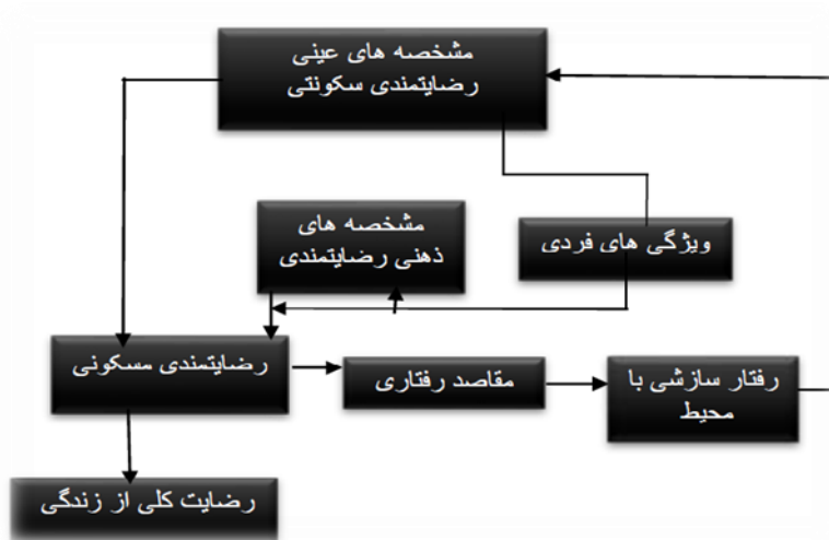
شکل ۱- مدل مفهومی رضایت مندی سکونتی (۱۱)