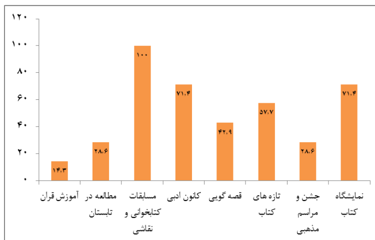
نمودار ۱. درصد فراوانی انواع خدمات جنبی در کتابخانه‌ها