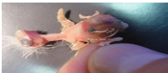
نگاره ۲- وجود لکه سیاه در محوطه بطنی قناری همراه با تورم روده‌ها

نتایج سایر آزمایش‌های تشخیص باکتریایی، انگلی و قارچی منفی بود. جدول شماره ۱ علائم ثبت شده مربوط به نمونه‌هایی که تحت آزمایش‌های ویروسی و میکروبی قرار گرفتند را نشان می‌دهد. نگاره ۲ وجود لکه سیاه در محوطه بطنی قناری همراه با تورم روده‌ها را نشان می‌دهد. نگاره ۳ وجود لکه سیاه در محوطه بطنی قناری در سنین مختلف را نشان می‌دهد. نگاره ۴ تورم کبد، کیسه صفرا و کم خونی قناری را نشان می‌دهد.