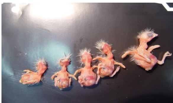
نگاره ۳- وجود لکه سیاه در محوطه بطنی قناری در سنین مختلف