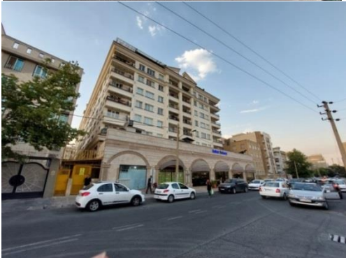
تصویر ۲: نمای کلی از مجموعه مسکونی چهارصد دستگاه (نگارنده) تصویر ۳: نمای کلی از مجموعه مسکونی خیام (نگارنده)