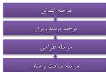
شکل (۴): فرآیندی برای توسعه مجدد اراضی قهوه ای در پژوهشی که لنی درباره فرآیند توسعه مجدد اراضی قهوه ای انجام می دهد به این نتیجه می رسد که

در راهنمای عوامل اجرایی برای توسعه مجدد اراضی قهوه ای (PDL) ۱۷ در انگلستان که توسط آژانس احیای ملی ارائه شده، چهار مرحله به صورت زیر آمده است (The National Regeneration Agency Error! Unknown switch (2006, 52): fargument.