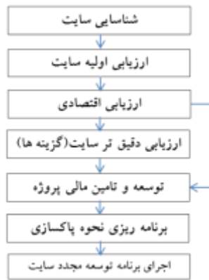
شکل (۲): فرآیندی برای توسعه مجدد اراضی قهوه ای

انجمن برنامه ریزی آمریکا در گزارشی دیگر فرآیند پنج مرحله ای را برای توسعه مجدد اراضی قهوه ای در (شکل ۳) ارائه می دهد (APA 2011, 52):