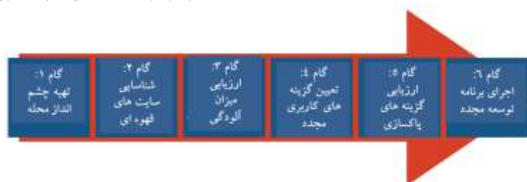
شکل (۱): شش گام اصلی برای توسعه مجدد اراضی قهوه‌ای

در تحلیل محتوا آنچه را محقق برای سنجش می‌پذیرد، واحدهای ثبت می‌نامند. واحدهای ثبت برای این تحلیل همان «مراحل اصلی فرآیندهای شناسایی شده برای توسعه مجدد» است که در نهایت با یکدیگر مقایسه می‌شوند. در ادامه، مراحل اصلی فرآیندهای پیشنهادی در منابع مختلف ذکر می‌گردد: