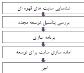
شکل (۳): فرآیندی برای توسعه مجدد اراضی قهوه ای

انجمن برنامه ریزی آمریکا در گزارشی دیگر فرآیند پنج مرحله ای را برای توسعه مجدد اراضی قهوه ای در (شکل ۳) ارائه می دهد (APA 2011, 52):