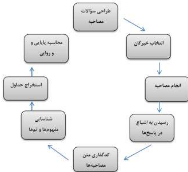
تصویر ۱: مراحل انجام پژوهش

مصاحبه‌ها اکتفا گردید و به دلیل بدست آمدن داده‌های تکراری، فراگرد گردآوری اطلاعات، بعد از انجام ۱۰ مصاحبه متوقف گردید.