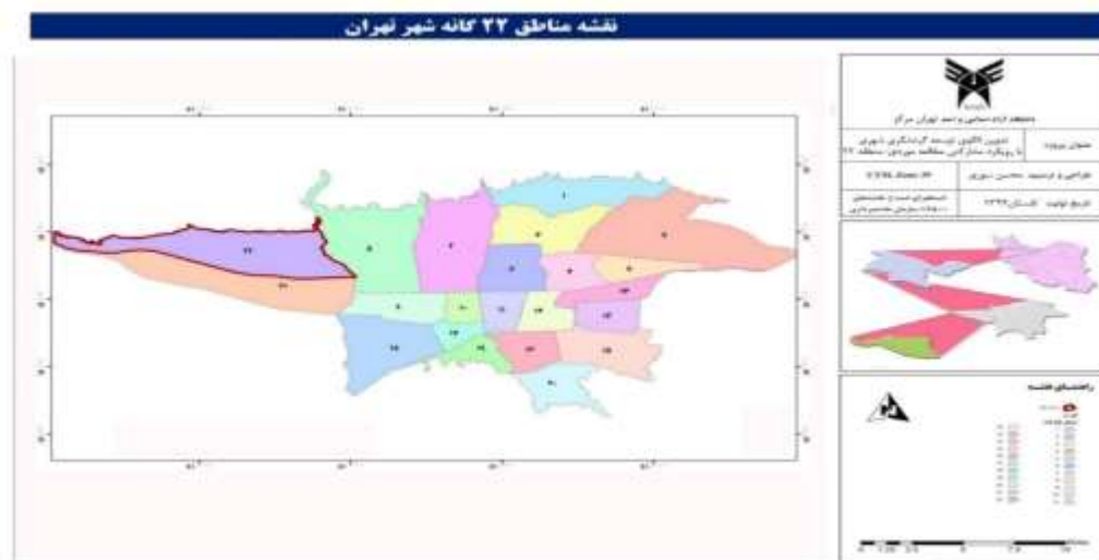
نقشه ۲ - موقعیت منطقه ۲۲ در بین مناطق ۲۲ گانه تهران