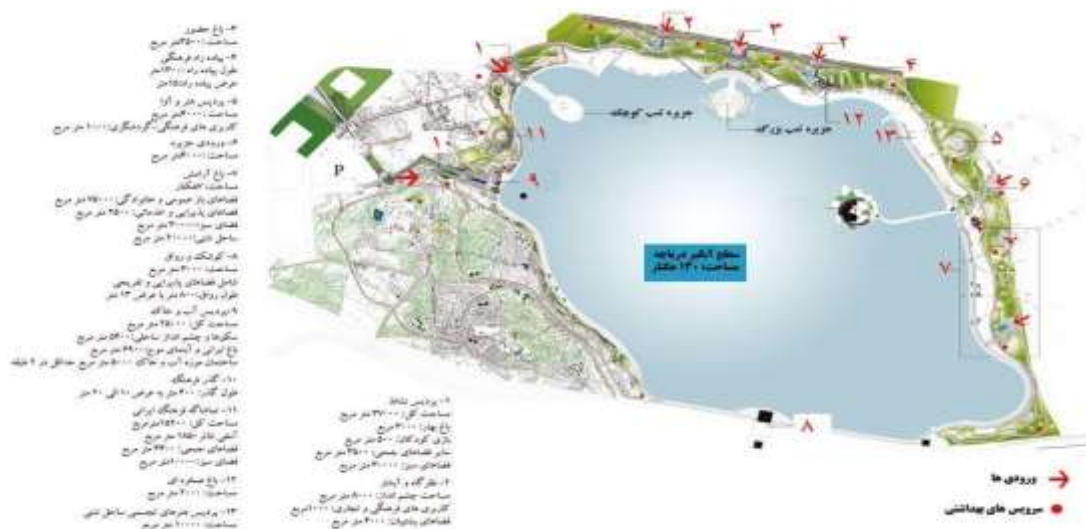
شکل ۱ - نقشه جزئیات و فضاهای خدماتی دریاچه