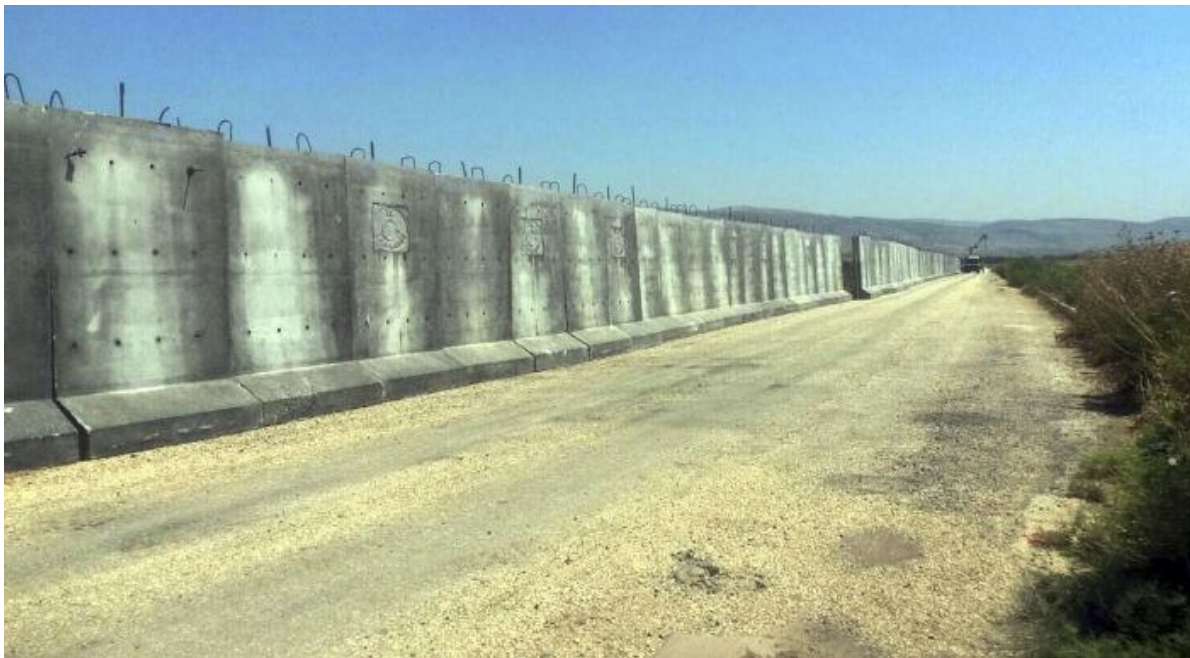
نمایی از دیوار بتونی مرزی میان ایران و ترکیه که توسط دولت ترکیه احداث شده است