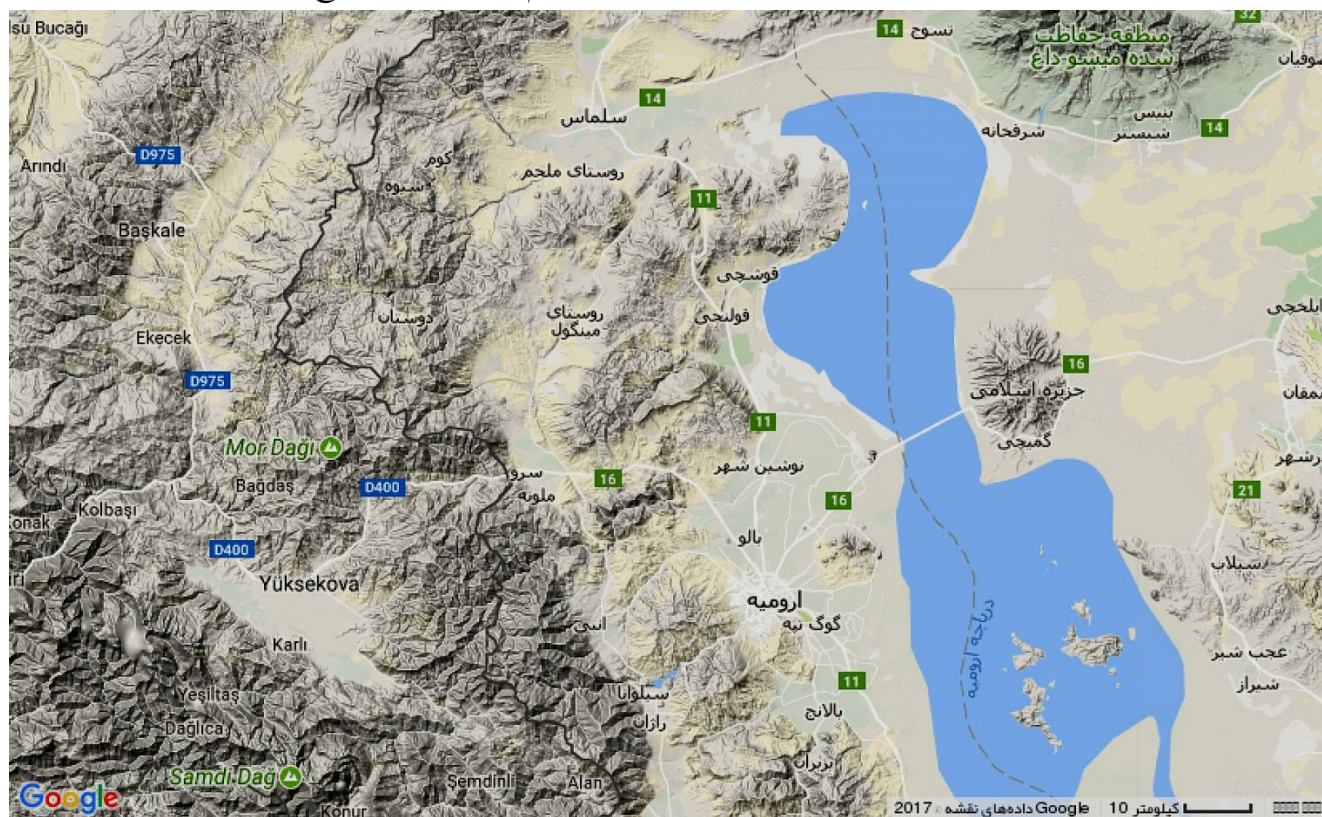
نقشه شماره دو: نحوه قرار گرفتن ارتفاعات مرزی میان دو کشور ایران و ترکیه