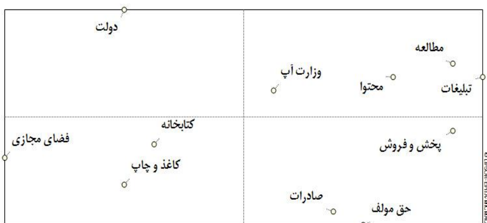
نمودار ۱- نمودار ادراکی متغیرهای کلیدی آینده کتاب در ایران به روش میک‌مک

سیستم در نظر گرفته می‌شوند. در بین این متغیرها، اغلب متغیرهای محیطی ۹ هستند که به شدت سیستم را مشروط می‌کنند اما عموماً نمی‌توانند توسط سیستم کنترل شوند. متغیرهای محیطی بیشتر به عنوان عامل اینرسی عمل می‌کنند.