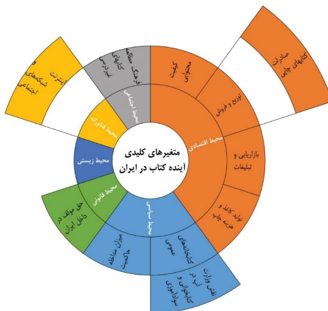
شکل ۱- مدل نهایی متغیرهای کلیدی آینده کتاب ایران براساس مدل پستل و رویکرد لایه‌ای

۶- «میزان مداخله (تصدی‌گری یا تولی‌گری) دولت در عرصه کتاب».