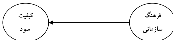
شکل ۲- رابطه فرضی بین فرهنگ سازمانی و کیفیت سود