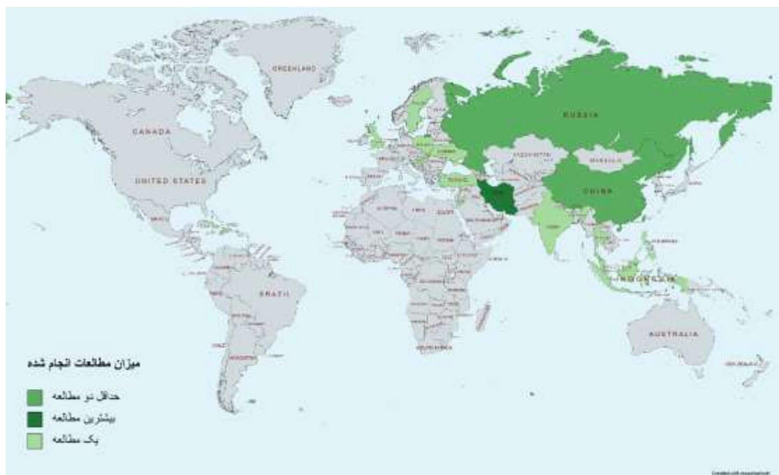
شکل ۲ - میزان توجه کشورها به موضوع کارآفرینی در حوزه گردشگری سلامت با توجه به تعداد مطالعات انجام شده