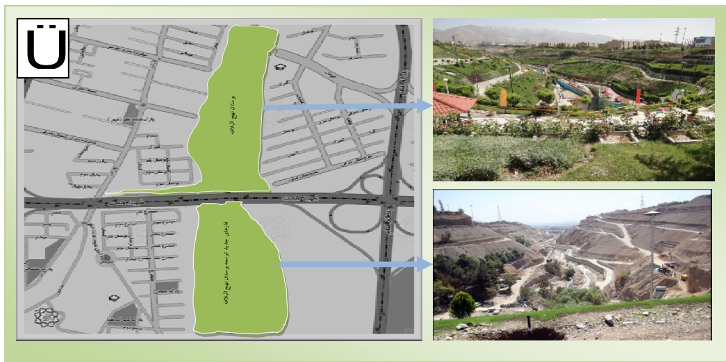
شکل ۲. موقعیت بوستان نهج البلاغه در شهر تهران

با این شرح با توجه به سؤالات و فرضیات مطرح، اقدام به بررسی و تحلیل آماری جهت سنجش هویت و ارتباط آن با منظر و مبلمان شهری شد. بدین سبب از آزمون آماری خی دو، کندال و گاما که برای سنجش مقیاسی رتبه‌ای (ترتیبی و اسمی) به‌طور هم زمان استفاده شده و نتایج مورد تجزیه و تحلیل قرار گرفته و جواب سؤالات و فرضیات حاصل شد.